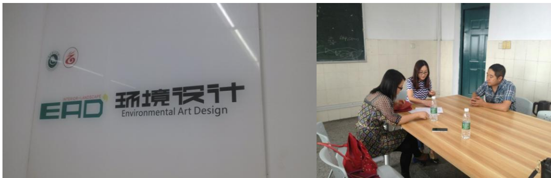
我校教师与四川理工学院环境艺术设计专业教师交流