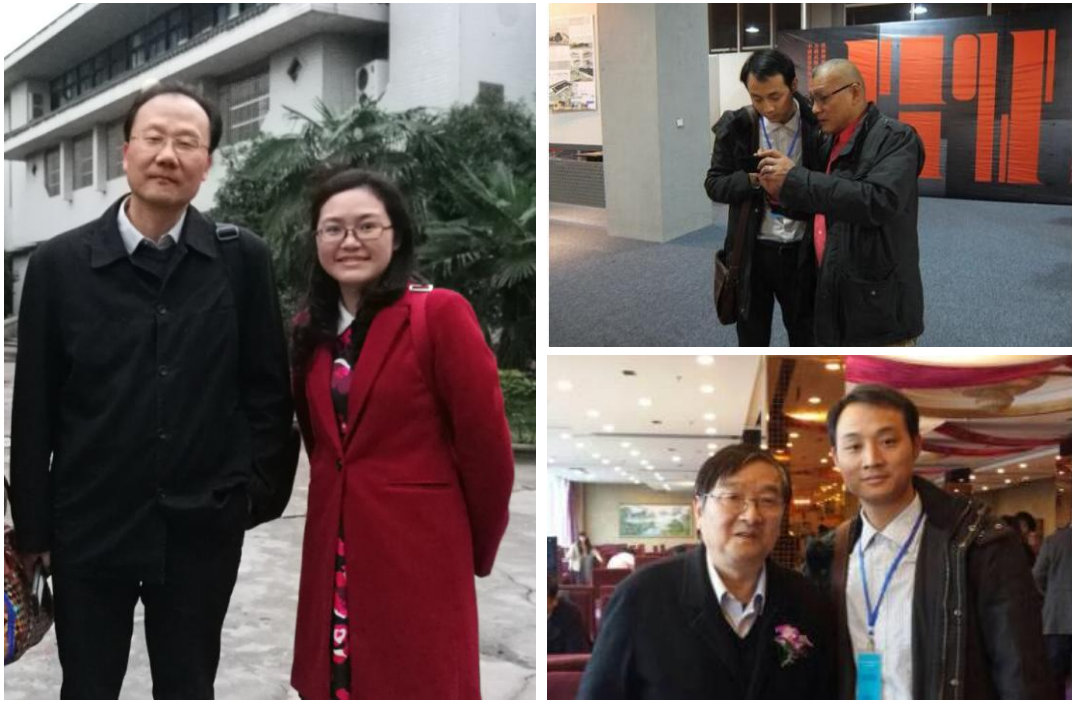
我院教师与刘滨谊教授、马克辛教授、高祥生教授交流