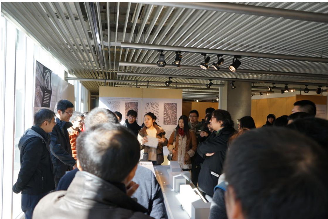
我校教师参与上海同济大学教师教学讨论会