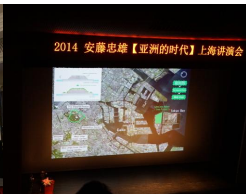
参与 2014 年安藤忠雄上海演讲