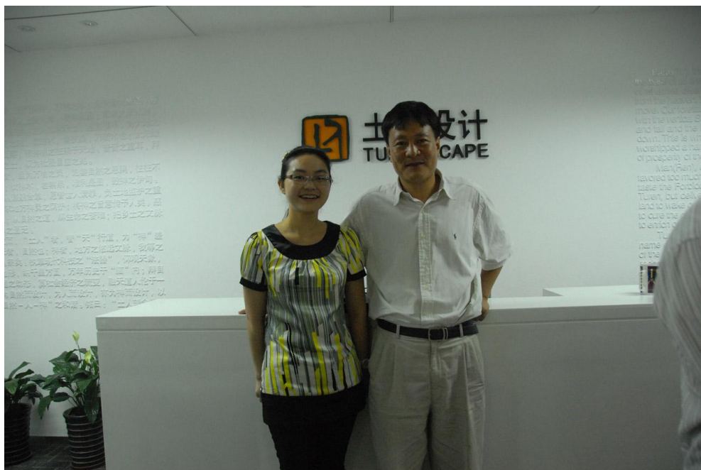
我院教师与俞孔坚教授进行交流