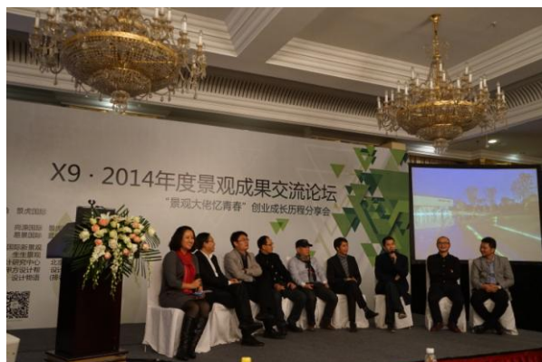
参与 2014 年景观成果交流论坛