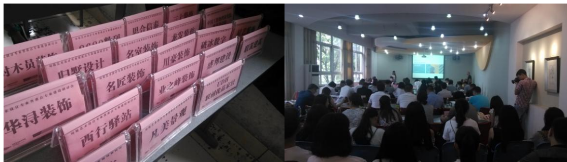
我院组织设计产业化背景下的高校教育模式探讨论坛