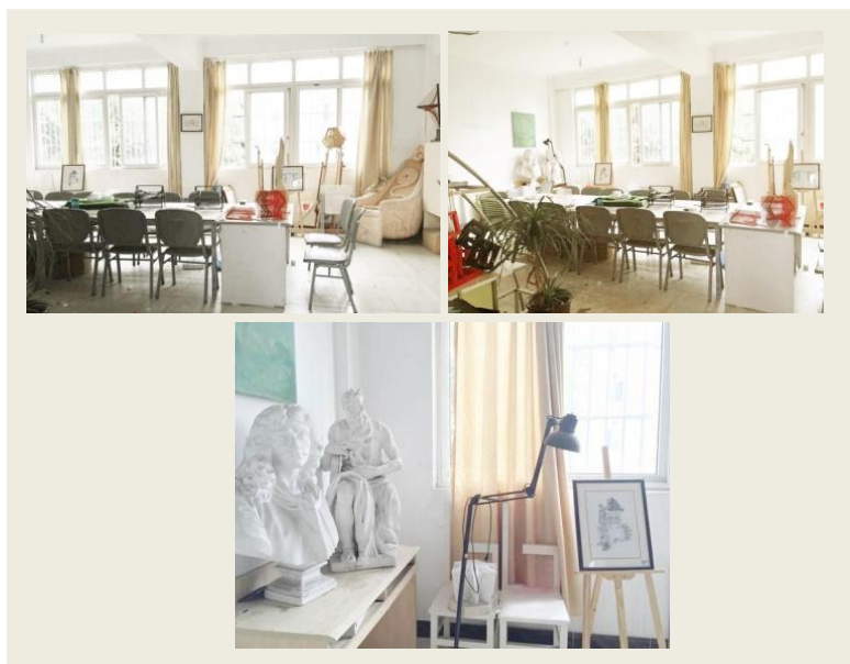
图2 造型艺术设计工作室内景